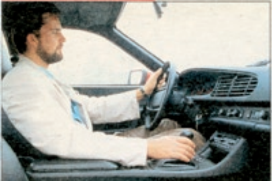
Mit dem Porsche fährt man entspannt durch Stadt und Land. Nervig: Bei hohen Drehzahlen pfeift der Turbolader wie ein Rohrspatz