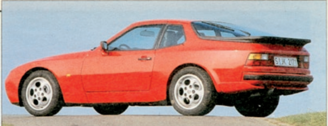
Der untere Heckspoiler am Porsche verrät das Turbomodell und preßt ihn bei hohem Tempo auf die Straße

stimmung erreicht, die auch für Reisen ausreichenden Komfort bereithält. Anders der Renault: Da darf man keinen schlechten Tag haben. Zum Beispiel wenn der Kopf schmerzt. Das Fahrwerk ist so hart, daß es jeden Kieselstein an die Wirbelsäule weitergibt. Oder wenn es regnet. Dann genügt ein Tick zuviel aufs Gaspedal, und der rennerproben Fahrer fährt kostenlos Karussell. Oder wenn es mal sehr schnell gehen muß. Ab Tempo 200 braucht der Renault starke Hän-