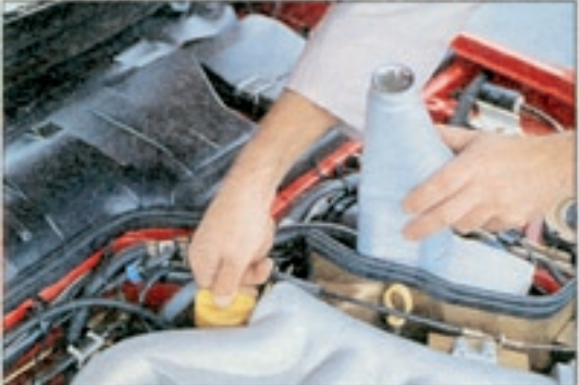
Hoher Ölverbrauch beim Porsche: Bis 0,8 Liter Ölverbraucht der Testwagen. Das Auffüllen erschwerte der stramm sitzende Ölnachfülldeckel