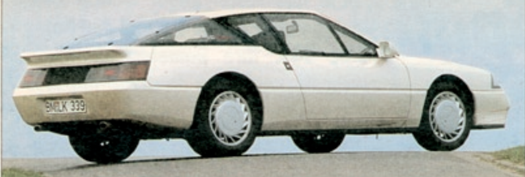
Futuristisches Renault-Design: Schwarze Rückleuchten und eine flache Kunststoffkarosserie

Porsche-Fahrer mögen mir verzeihen: Aber als ich die ersten Kilometer mit den beiden Konkurrenten dieses Vergleichstests hinter mir hatte, kam es mir vor, als würde ich einen Formel 1-Rennwagen mit einer Luxusanteile vergleichen. Der 944 wirkte plötzlich ungeheuer komfortabel, geradezu unsportlich.